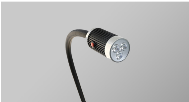
Lámpara de exploración