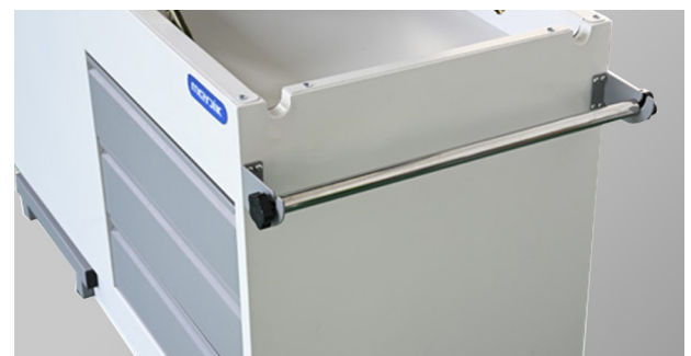
Portarrollo de papel