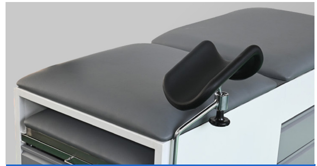
Soporte para piernas