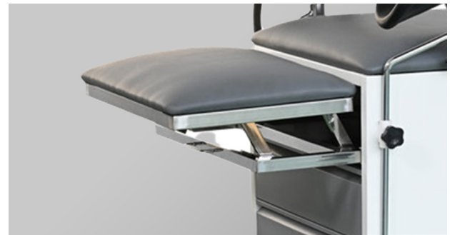
Sección de pies