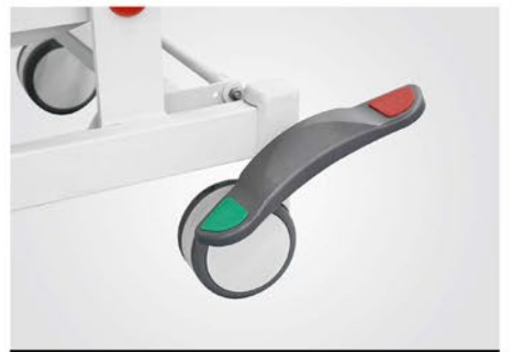
SISTEMA DE BLOQUEO CENTRAL