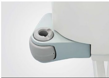
RUEDAS CON PARACHOQUES