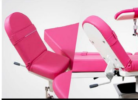
SECCIÓN DE PIERNAS PLEGABLE