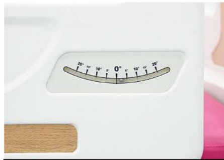
INDICADOR DE ÁNGULO